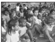
Creche Maria de Nazaré