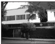
Centro Espirita Léon Denis (CELD)

Participe desta causa e ajude o CELD a manter suas Obras Sociais