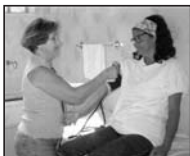
Atendimento na OSAA