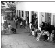
Obra Social Antonio de Aquino