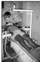
Atendimento na OSAA