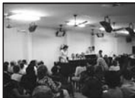
Dia de Reunião Pública no CELD